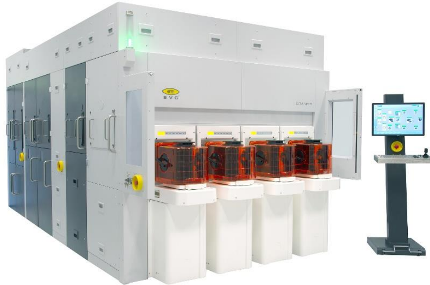
GEMINI®FB 集成熔融键合系统。数据来源：EV 集团

备，为重要的上下游工艺提供支持，包括等离子活化和清洁技术，以加快部署和完善 D2W 混合键合技术。数年之前，EV 集团的 GEMINI FB 技术已配置用于 D2W 集成流程，满足 D2W 键合需求。EVG®320 D2W 芯片准备和活化系统则用于 D2W 键合的直接贴装，提供与 D2W 键合机的直接接口。EVG®40 NT2 套刻计量系统使用 AI、前馈和反馈回路进一步提高混合键合良率。在这些技术之外，EV 集团又推出完整的端到端混合键合解决方案，以加速部署 3D/异构集成。”