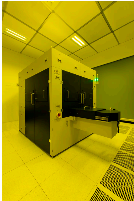
圖一_ EVG®770 NT 步進重複奈米壓印微影系統

EVG®770 NT 為擴增實境波導管、晶圓級光學技術與先進生物醫學晶片 促成複雜的微型與奈米結構的大面積母模加工